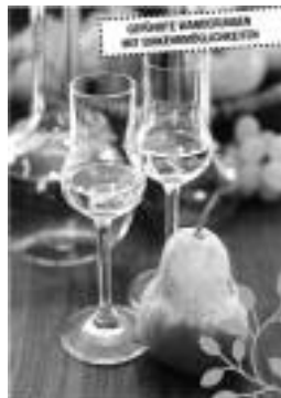
NORDRACHER OBSTBRENNERWEG Saisoneröffnung Sonntag, 20. Mai 2012

Pünktlich zur Sommersaison eröffnet am Sonntag, 20. Mai 2012, ab 09.00 Uhr der Nordracher Obstbrennerweg.