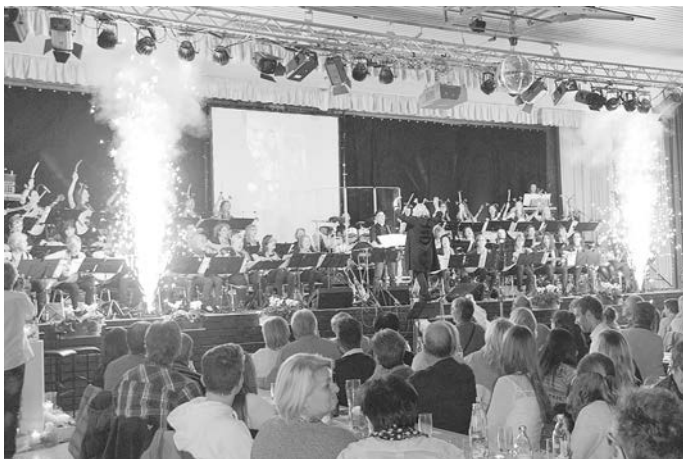
Tickets für das Jahreskonzert des Gitarrenverein Nordrach sind seit Sonntag, den 15. Oktober 2017, online erhältlich.

Karten für die beiden Konzertabende können ab Sonntag, den 15. Oktober, bis einschließlich 26. Oktober online unter www.gitarrenverein-nordrach.de erworben werden. Der Eintrittspreis beträgt acht Euro pro Sitzplatz.