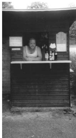
So begann alles am 01.05.1994.