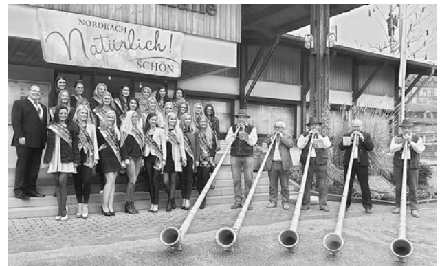
2015 besuchten die Miss-Germany-Anwärterinnen zum dritten Mal Nordrach. Am 13.02.16 steht der vierte Besuch an.

Zudem können sich bei der Veranstaltung die Besucher ein signiertes Autogramm ihrer persönlichen Favoritin mit nach Hause nehmen. Der Eintritt ist frei.