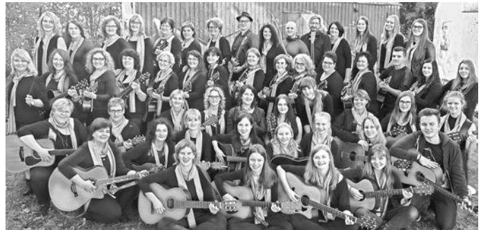
Ein ganzes Wochenende Musik: Der Gitarrenverein Nordrach bereitete sich im Baden-Powell-Haus in Bergach intensiv auf zwei Konzertabende am 5. und 6. November 2016 in Nordrach vor.

Die Veranstaltung beginnt am 5. November um 19.30 Uhr , am 6. November um 18 Uhr .