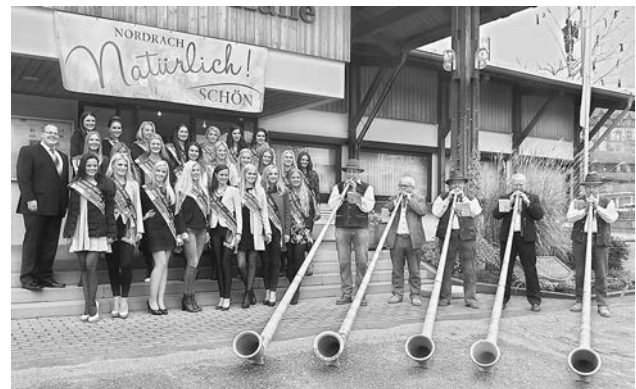
2015 besuchten die Miss-Germany-Anwärterinnen zum dritten Mal Nordrach. Am 13.02.16 steht der vierte Besuch an.

Zudem können sich bei der Veranstaltung die Besucher ein signiertes Autogramm ihrer persönlichen Favoritin mit nach Hause nehmen. Eintritt frei.