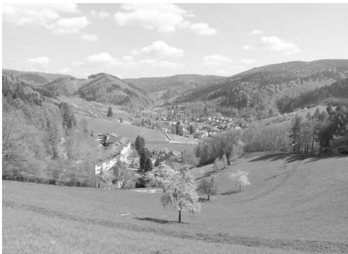
Herrliche Aussicht vom Maileseckle im Frühling.

Kennt ihr Ditsch und Datsch oder Lirum, Larum, Löffleli, wenn nicht, dann kommt einfach vorbei. Über den Maile-Gießler-Hof gehen wir zum Ausgangspunkt zurück, das ist nur noch ein kurzes Stück. Anschließend, nach Absprache, folgt noch ein Einkehrschwung. Alle sind eingeladen, Mitglieder und Gäste, Alt und Jung. Wir treffen uns auf dem Kirchplatz 13.30 Uhr, also um halb Zwei und hoffen, viele von Euch sind mit dabei! Führung: Ingeborg Bruder mit Familie, (Rückfragen unter Telefon 07838/374).