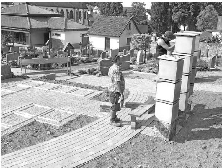
Die zusammengesetzten Stelen.

Im Zuge der Baumaßnahme konnte ein weiteres Problem gelöst werden. Im Laufe des Sommers ging immer wieder das Gießwasser aus, weil die beiden vorhandenen Wassertröge vor allem abends rasch ausgeschöpft waren. Zwei zusätzliche Wasserentnahmestellen wurden an der Friedhofsmauer zur Halle hin neu angelegt. Die Gesamtkosten belaufen sich auf ca. 110.000 Euro.