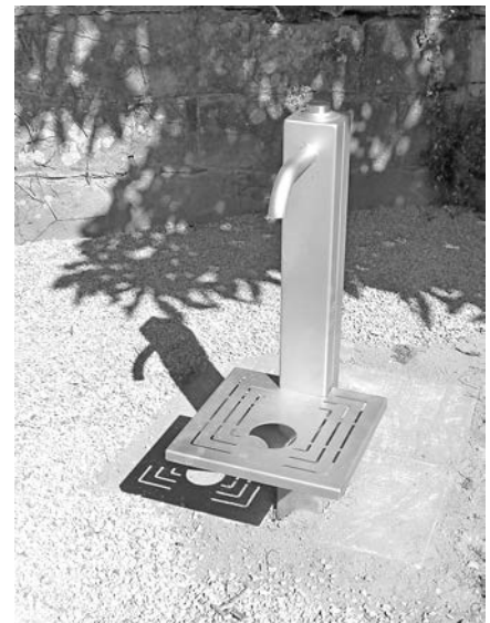
Zusätzliche Wasserentnahmestellen lösen das Gießwasserproblem.

Ein schönes Wochenende und eine gute neue Woche wünscht Ihnen Ihr Bürgermeister Carsten Erhardt