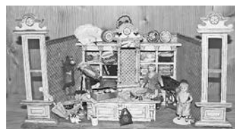
Dieser Textilladen erweitert seit Ende August die Sammlung im Nordrachter Puppen- und Spielzeugmuseum.

Das Puppen und Spielzeugmuseum ist ganzjährig Samstag, Sonntag und an Feiertagen von 14 – 17 Uhr sowie vom 1. Juli bis 15. September täglich von 14 – 17 Uhr geöffnet. Gruppenführungen können auch außerhalb der Öffnungszeiten gebucht werden und eignen sich beispielsweise bestens als Vereinsausflug. Anmeldungen nimmt die Touristen-Information Nordrach entgegen.