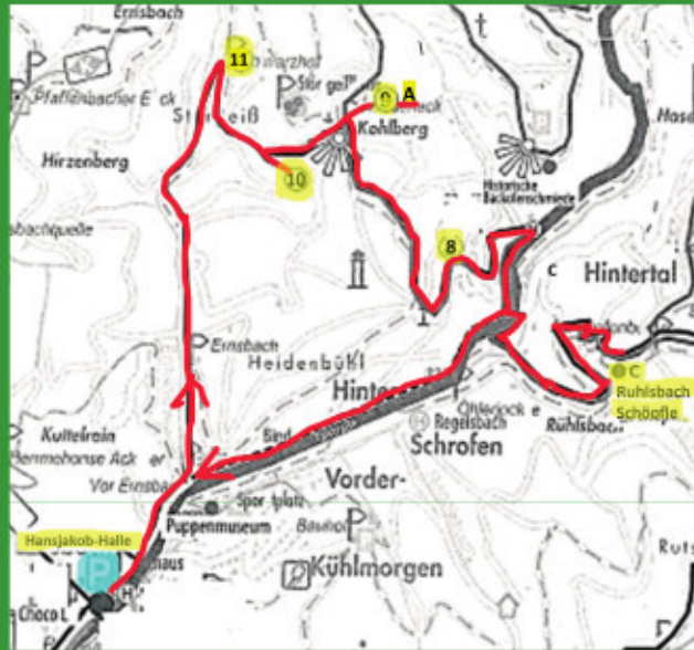
Obstbrennerhöfe entlang der Wegstrecke

Wegstrecke: ca. 8 km Höhenmeter: ca. 280 m