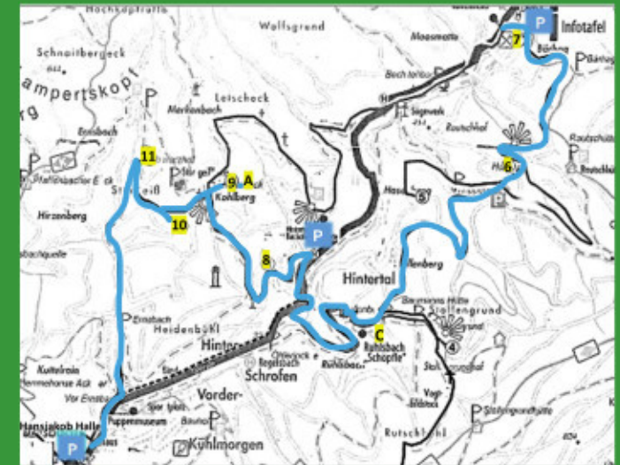
Obstbrennerhöfe entlang der Wegstrecke

Wegstrecke: ca. 13 km Höhenmeter: ca. 450 m